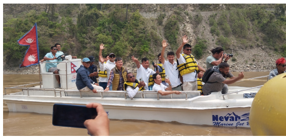
पर्यटक आकर्षित गर्ने योजना पनि अघि सारिएको छ।